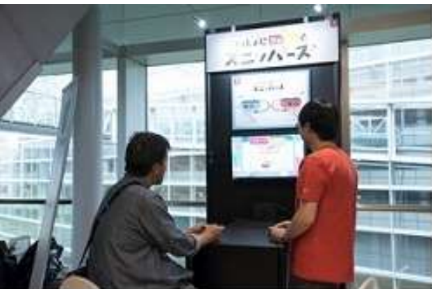
写真-ボランティアスタッフ作業風景