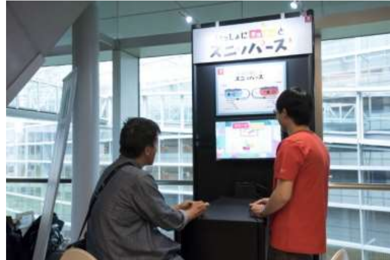
Unity製ゲームの展示案内