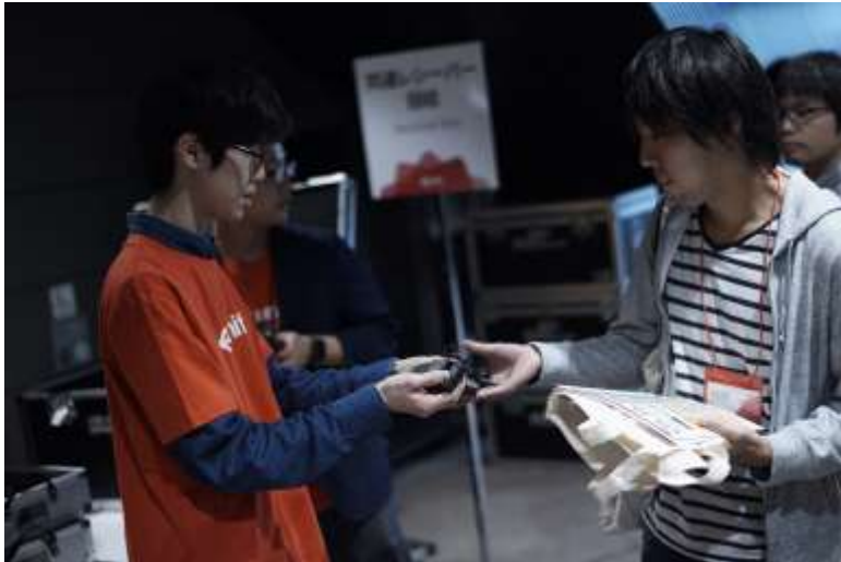
同時通訳レシーバーの配布回収